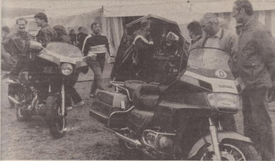
Viel bestaunt waren die schnittigen Maschinen – nicht nur bei der jüngeren Generation.

5. Motorradtreffen des Fronberger Clubs war wieder ein Erfolg / Weniger Teilnehmer