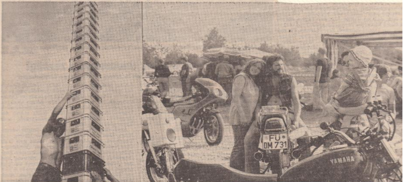
Mit Spielen wie dem Stapeln von Bierkästen (links) vertrieb man sich die Zeit beim Motorradtreffen, zu dem Gäste bis aus Belgien gekommen waren.

fuhren zum nahegelegenen Kiesweiher, um sich ein wenig abzukühlen. Gegen Abend begannen die Wettspiele. Ob Tauziehen, Bierkastenstapeln, Holzsägen oder Apfelessen, jeder Teilnehmer gab sein bestes, um zur Unterhaltung der anderen beizutragen. Bei der Meldung gab es schöne Pokale, die für die weiteste Anfahrt oder den größten Club verliehen wurden. Um neun Uhr nahm die „Rattle Gang“ den Showteil in die Hand. Mit Anheizensong wie „da da da“ oder „da guade oide Rock 'n' Roll“ wurden die Leute von den Sitzen gehoben. Überall sah man die Tänzer ihren Rock aufs „Parkett“ hämmern. Nach einer heißen Nacht folgte ein spannender Morgen mit der Pokalverleihung. Die Abfahrt zog sich über den ganzen Vormittag hin.